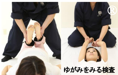
ゆがみをみる検査